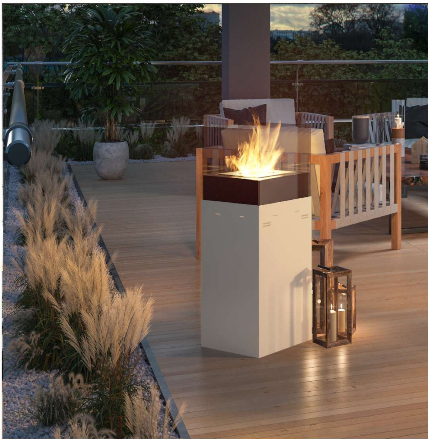
Biokominek Instand 850