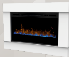
Rama do Prism 34" biała 211354 5011139211354