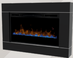
Rama do Prism 34" czarna 221136 50111392211361