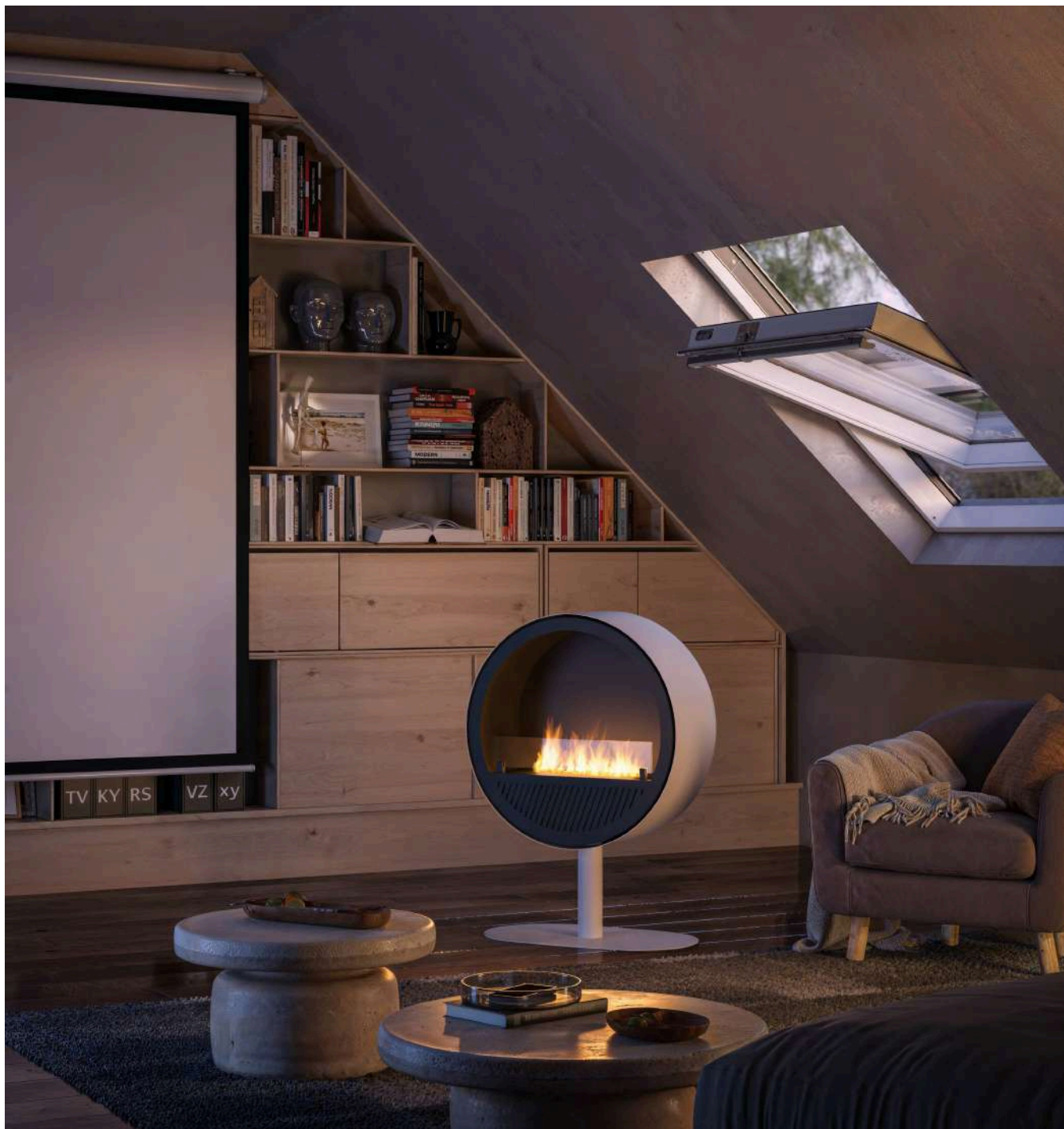
Biokominek Incyrcle Slim Stand