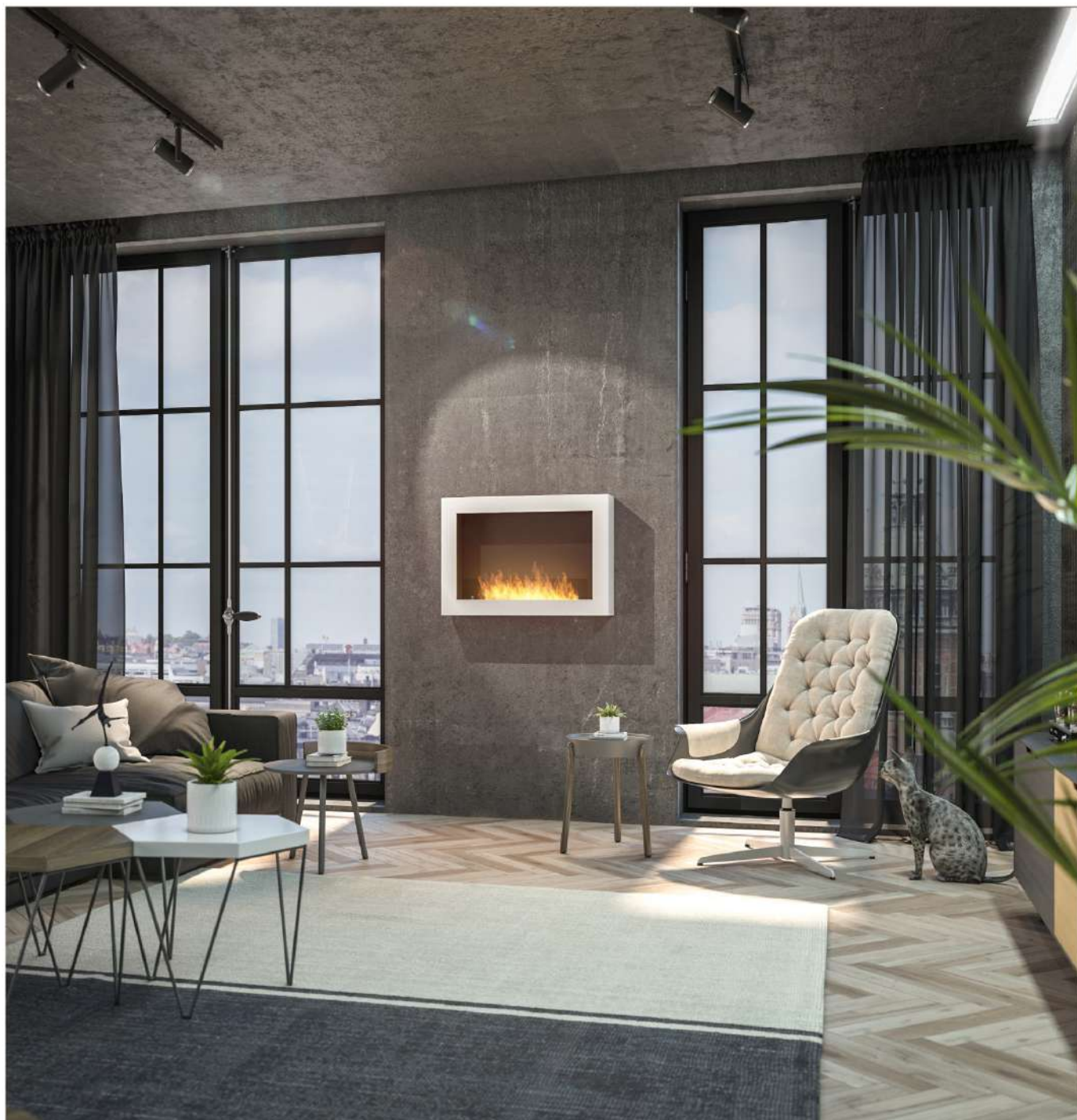
Biokominek Murall 800