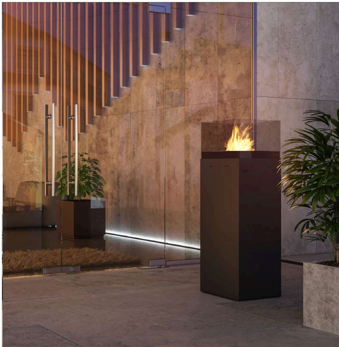
Biokominek Instand 1150